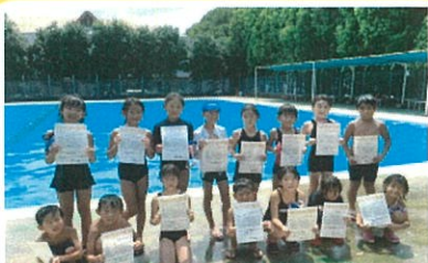
最終日に記録証がもらえるよ♪